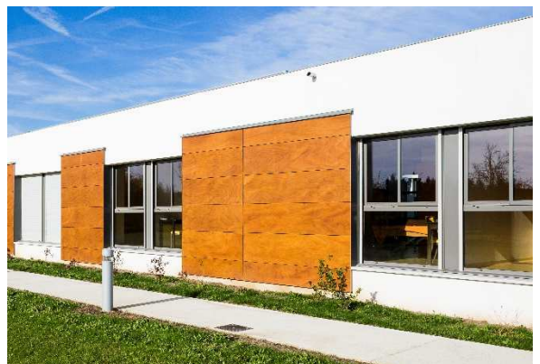
DR SAPA BUILDING SYSTEM - PHOTOGRAPHE WWW.B-ROB.COM EHPAD MOISSAC - BONETTO ET CAPMAS ARCHITECTE DPLG

La version 32 mm garantit la pose de vitrages acoustiques spécifiques, permettant un affaiblissement jusqu'à 35 dB Ra.tr . Elle assure un confort optimal en milieu urbain. Idéale pour les logements collectifs, les établissements scolaires, les chambres d'hôtels ou encore les bureaux situés dans des rues animées du centre-ville ou à proximité immédiate de grands axes de circulation.