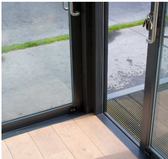
DR SAPA BUILDING SYSTEM - PHOTOGRAPHE WWW.B-ROB.COM

Le couissant PERFORMANCE 70 CL affiche un coefficient Uw de 1,5 W/m 2 .K* et un indice AEV A4 E7B VA2* , qui permettent de répondre aux exigences des Bâtiments Basse Consommation (BBC) et à la RT 2012.