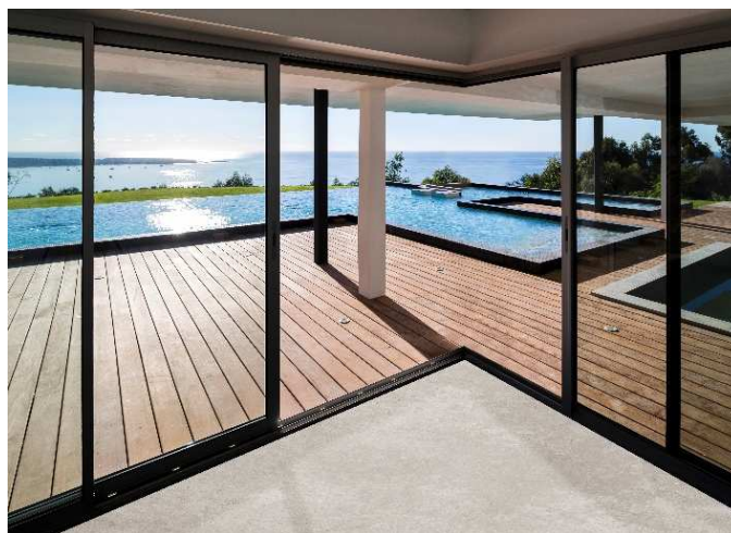
DR SAPA BUILDING SYSTEM - PHOTOGRAPHE WWW.B-ROB.COM ARCHITECTE GILLES BROUSSARD

En centre-ville ou à proximité d'une route au trafic régulier, cette baie coulissante contribue au bien-être intérieur grâce à un affaiblissement acoustique qui peut atteindre 35 dB Ra.tr* .