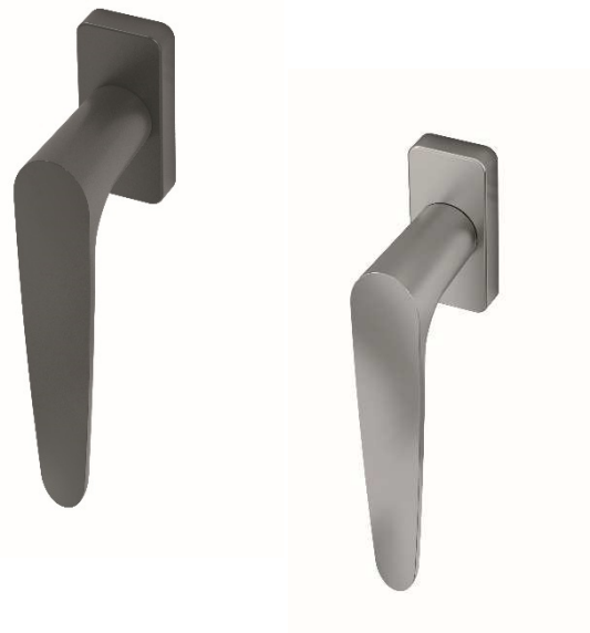
DR SAPA BUILDING SYSTEM

L'ensemble de l'offre de poignées se décline sur les portes, fenêtres et baies coulissantes de la gamme PERFORMANCE 70 pour jouer la totale harmonie ! Certifiées conformes selon la norme DIN EN 1906 : 2012, elles s'adaptent aux menuiseries à usage intensif des Établissements Recevant du Public (restaurants, hôtels, cafés, équipements scolaires...). Résistantes, elles sont également traitées en PVD afin de se protéger de la corrosion et des climats extrêmes (fortes chaleurs, gelées...).