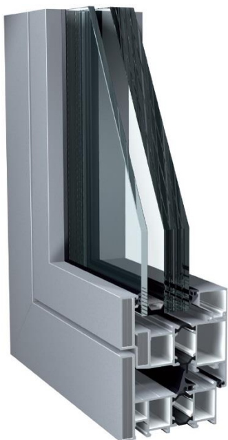
DR SAPA BUILDING SYSTEM

Les châssis en aluminium se distinguent par la profondeur de leur cadre de 92 mm et le renfort de leurs dormant et ouvrants par deux inserts de 4 mm en acier de blindage . Les systèmes de serrures et d'équerres réglables sont également consolidés et les parcloles tubulaires internes empêchent le déclipsage depuis l'extérieur. Un vitrage feuilleté de sécurité blindé optimise la protection de l'ensemble.