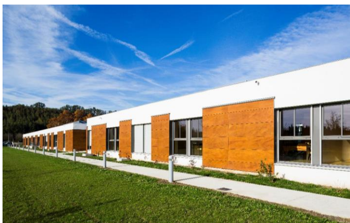
DR SAPA BUILDING SYSTEM - PHOTOGRAPHE WWW.B-ROB.COM EHPAD MOISSAC - BONETTO ET CAPMAS ARCHITECTE DPLG