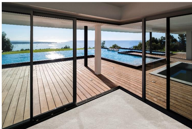
DR SAPA BUILDING SYSTEM - PHOTOGRAPHE WWW.B-ROB.COM ARCHITECTE GILLES BROUSSARD