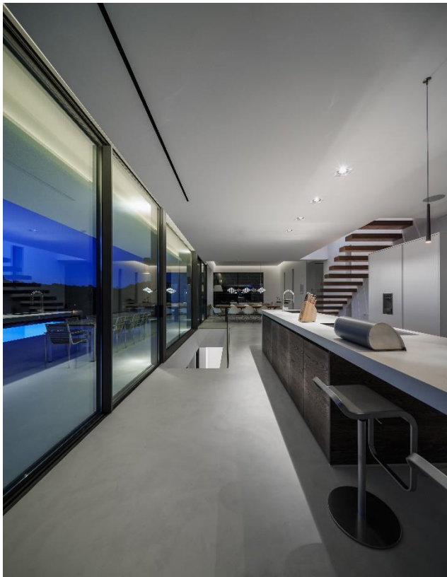
COULISSANT PERFORMANCE 70 CL DR SAPA BUILDING SYSTEM

Offre complète « Sécurité » dédiée à l'habitat et aux bâtiments : pour une protection optimale des personnes et des biens