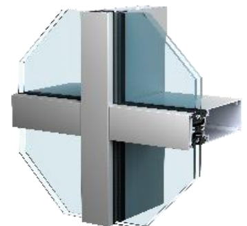
Façade haute sécurité (RC)