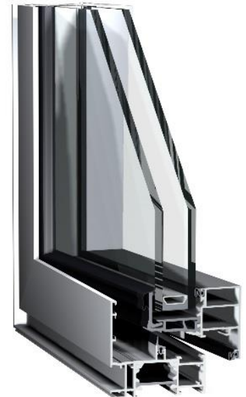
Fenêtre PERFORMANCE 70 OC+

En France, un cambriolage se produit en moyenne toutes les deux minutes. La résistance mécanique aux effractions sur les fenêtres, les portes et les murs-rideaux devient essentielle. Conçues pour être conformes aux normes européennes les plus exigeantes, les solutions Sapa sont classées CR2 ou CR3 suite à des tests réalisés par des organismes indépendants .