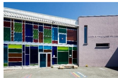
ÉCOLE FRANÇOIS VILLON CRÉDIT PHOTO SAPA ARCHITECTE

Ce système de châssis, intégré au mur-rideau, facilite l'accès des pompiers devant intervenir en cas d'incendie par exemple. Le mécanisme de condamnation est manœuvrable depuis l'intérieur pour assurer le désenfumage et depuis l'extérieur pour atteindre les parties du bâtiment confinées par le feu, en accord avec la réglementation des ERP. Esthétique, l'ouvrant Pompier ÉLÉGANCE IT NS FE s'adapte à tous les types de chantiers, sans rupture visuelle avec le mur-rideau.