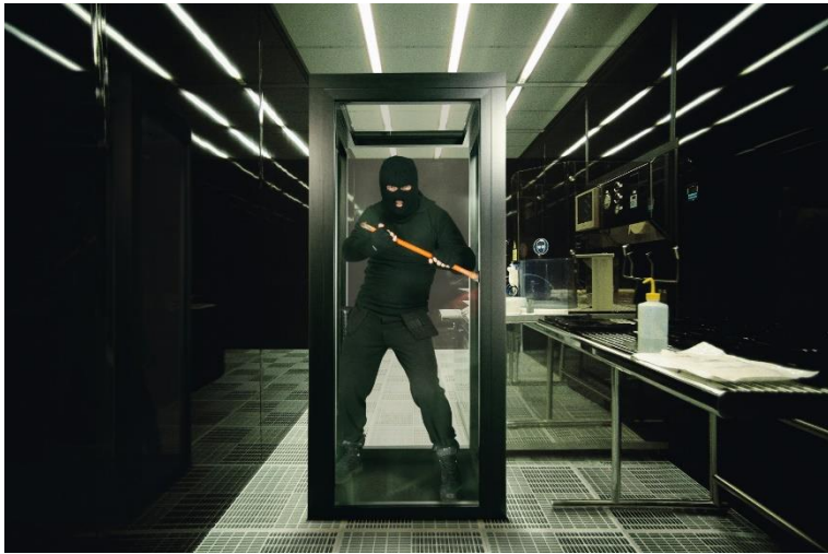
DR SAPA BUILDING SYSTEM