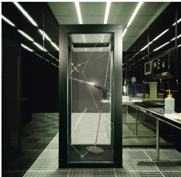
DR SAPA BUILDING SYSTEM