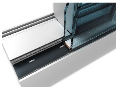
DR SAPA BUILDING SYSTEM

Sapa franchit un nouveau cap dans le gain de luminosité naturelle. ARTLINE XL RIF bénéficie du dormant le plus fin du marché, 150 mm contre 157 mm en moyenne . La nouvelle réduction de la hauteur de l'encadrement inférieur, offre un taux d'apport de lumière de plus de 99 % . La surface vitrée affleurante au sol apporte un style résolument épuré . De 26 mm d'épaisseur, les dispositifs de verrouillage minces, renforcent l'effet de transparence . La gouttière moins profonde favorise l'esthétique d'ensemble lorsque le vantail est ouvert.