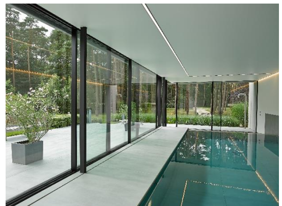
SAPA BUILDING SYSTEM Architect ANTE ARCHITECTEN BVBA - Arch. Anne-Mie Noens