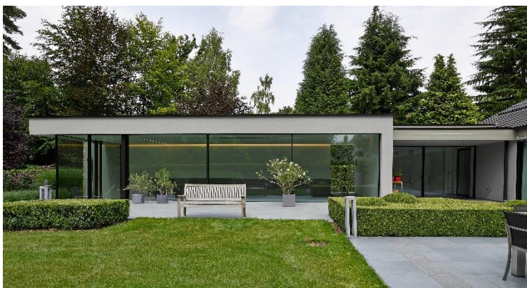
SAPA BUILDING SYSTEM Architect ANTE ARCHITECTEN BVBA - Arch. Anne-Mie Noens, Sint-Niklaas, Belgium