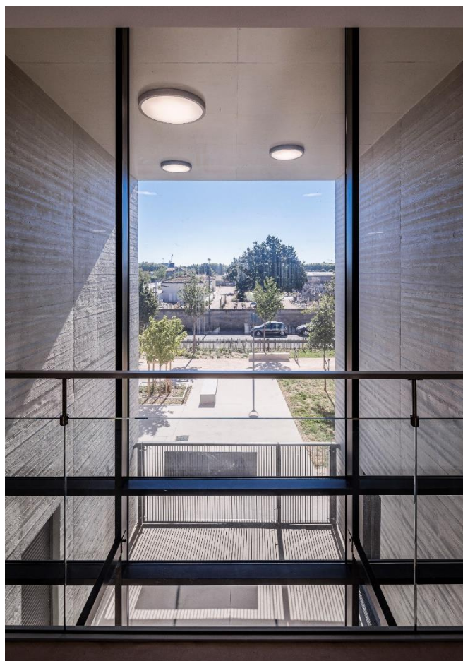
Crédit photo Sapa - Photographe Meero © Agence d'architecture : Rue Royale Architectes

La verticalité des menuiseries prédomine dans ce programme. Au-delà des grands murs-rideaux ELEGANCE 52 des patios, les fenêtres à soufflet, toute en hauteur, renforcent la sensation d'espace dans les salles tout en protégeant des regards extérieurs. Leur largeur, d'environ 1 m, suit le tramage de la façade du premier étage. Elles sont ponctuellement coupées d'éléments horizontaux pour apporter du rythme à l'enveloppe.