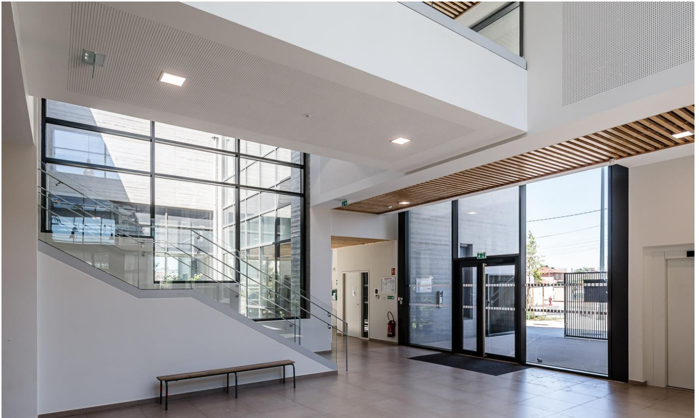
Crédit photo Sapa - Photographe Meero © Agence d'architecture : Rue Royale Architectes