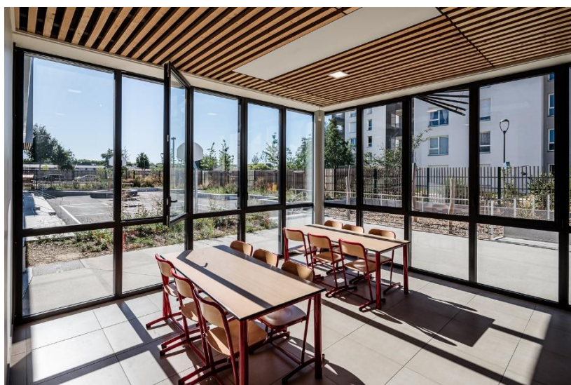
© Agence d'architecture : Rue Royale Architectes